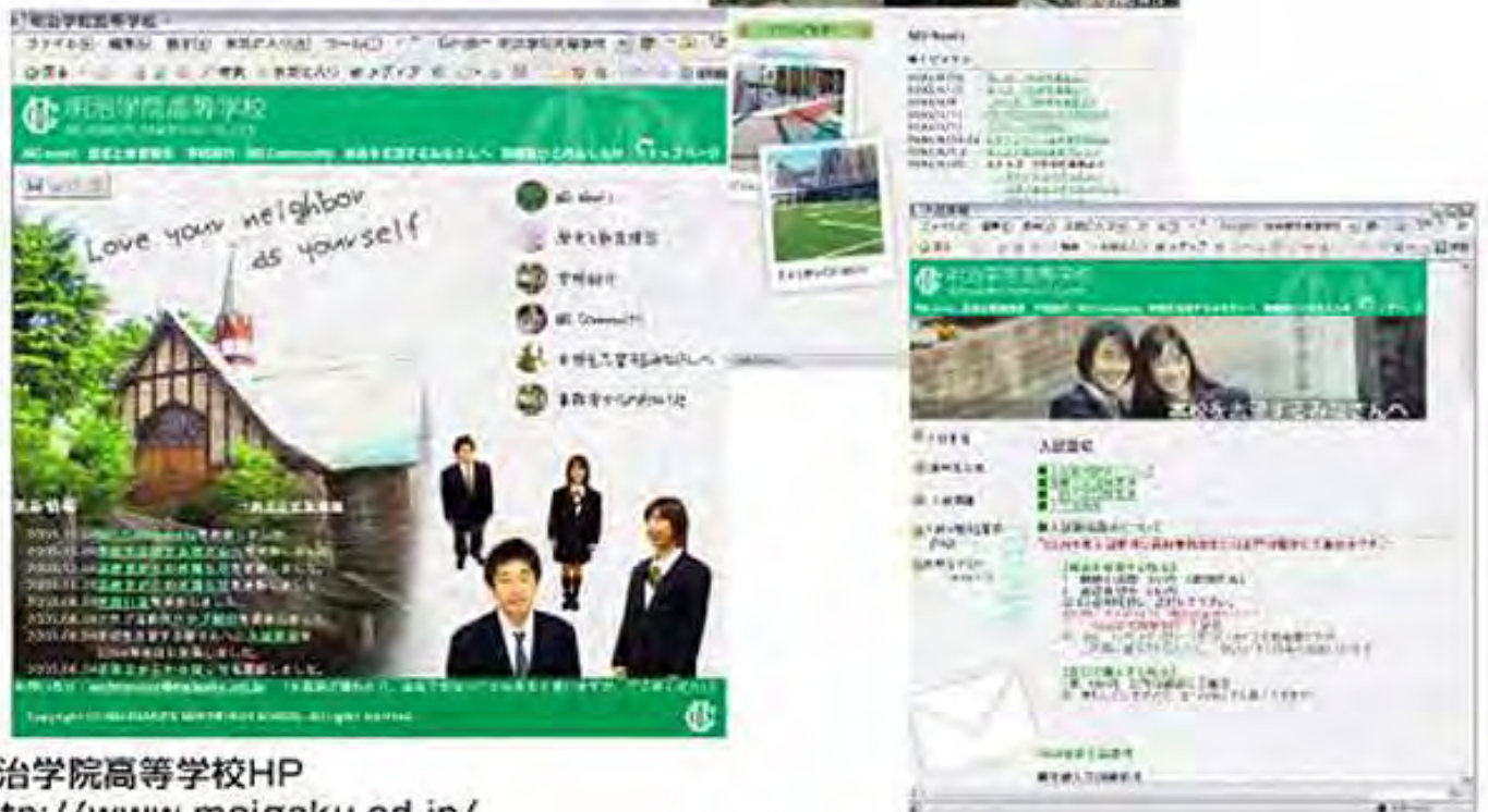
明治学院高等学校HP http://www.meigaku.ed.jp/