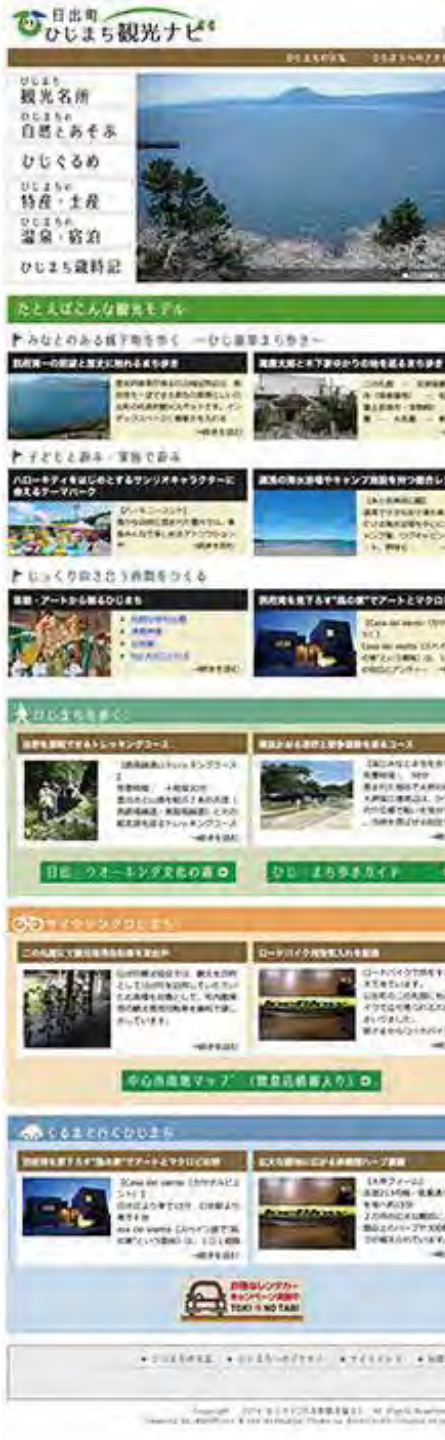
島根県立図書館システムデザイン提案